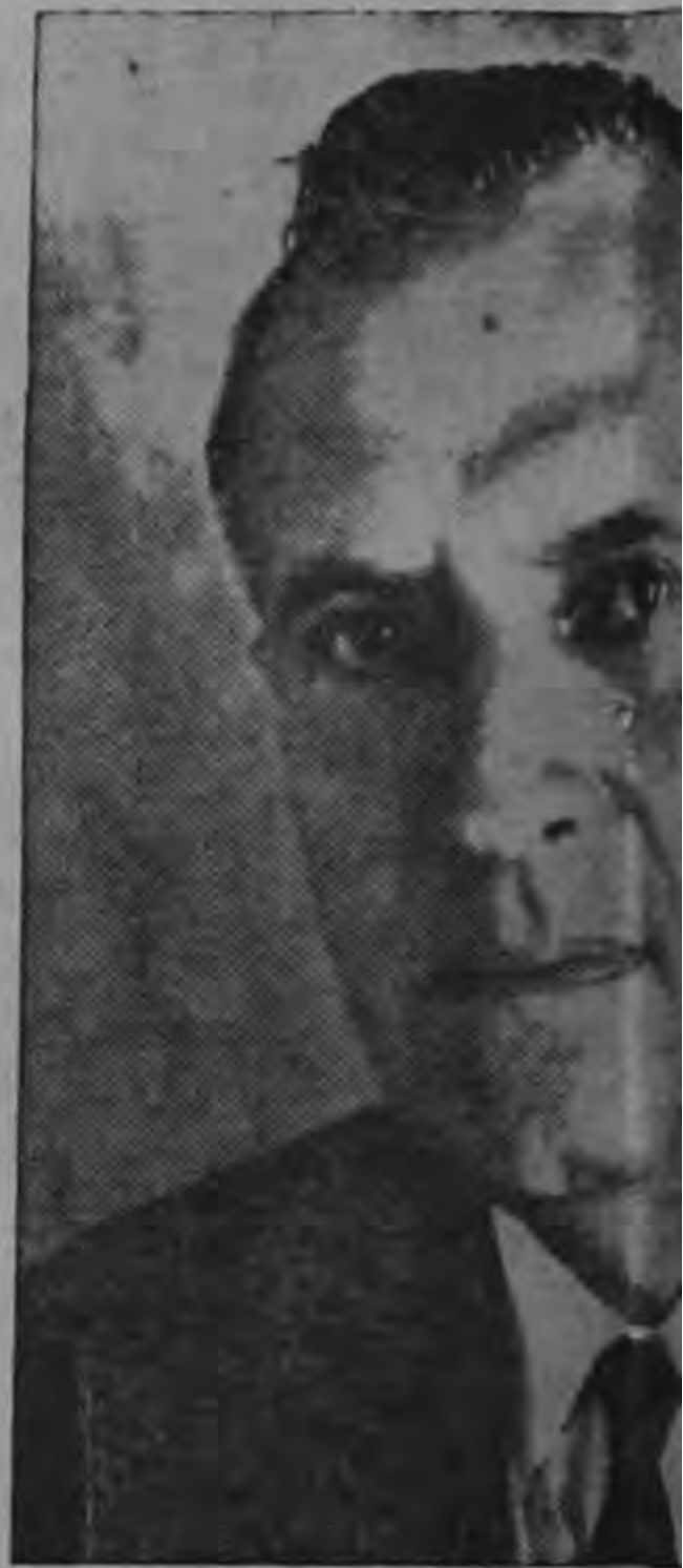
Dr. Rafael Angel Calderón Guardia, Jefe y Presidente del Partido Republicano.

Y así podríamos seguir comentando sobre si es comunista la creación de la Caja Costarricense de Seguro Social; sobre si tuvieron origen comunista las leyes sobre colonización y reparto de tierras; y otra cosa más: Cuando la revolución de 1948 asumió triunfante el Poder, ¿Cuáles leyes fueron derogadas por encontrarlas de origen comunista? ¿Qué reforma Constitucional fue eliminada por el trámite rápido del Decreto-Ley? ¿Cuál disposición Legislativa o Constitucional, dictada por el Partido Republicano mereció derogatoria una